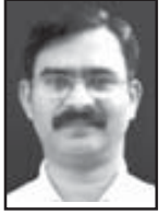
ബെന്നി പുനത്തറ ശാലോം മിനിസ്ട്രീസ് പെരുവണ്ണാമുഴി, കോഴിക്കോട് ജില്ല